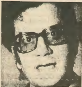
Αν βουλέψουν οι αριστεροί φεύγω εγώ